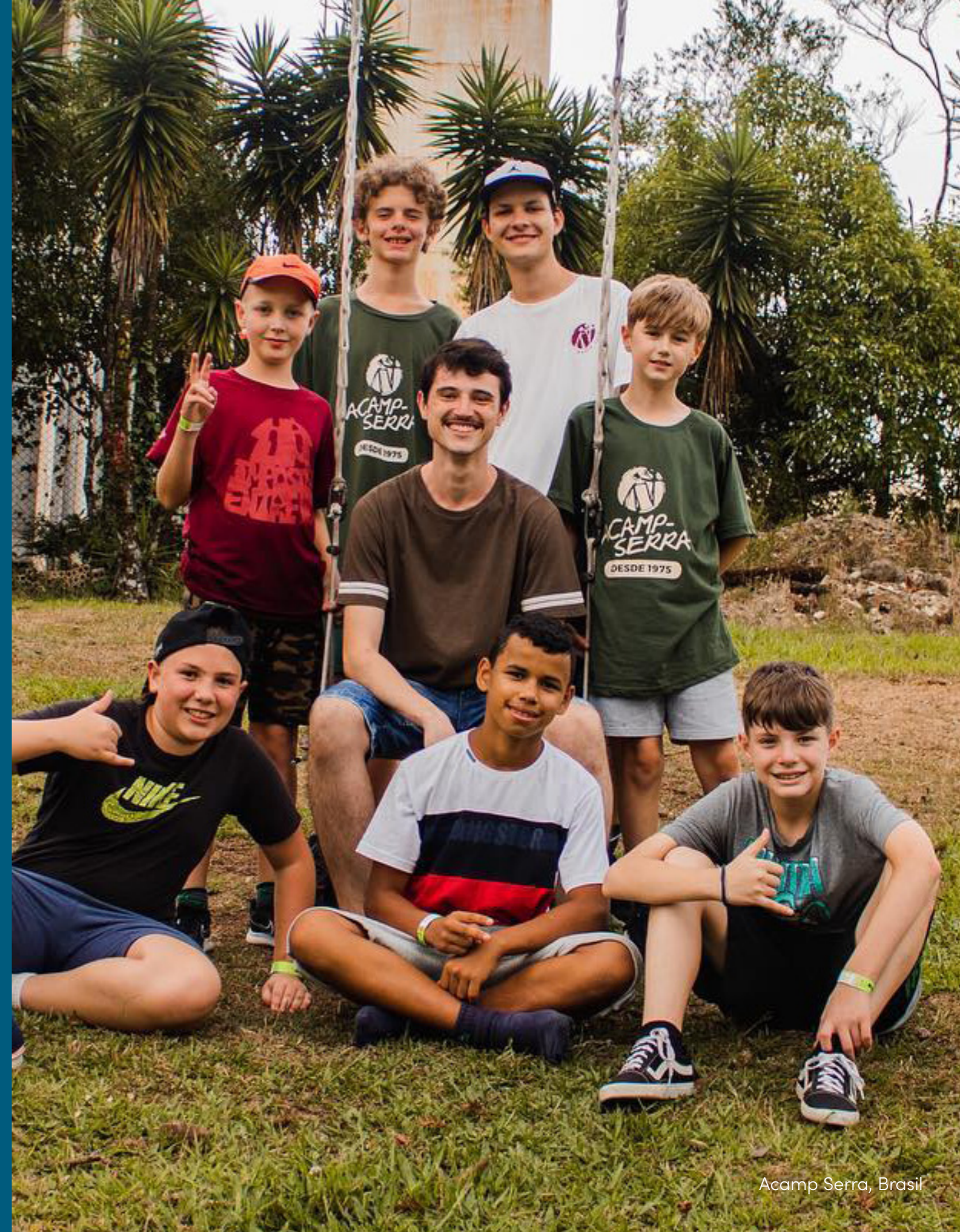
Acamp Serra, Brasil