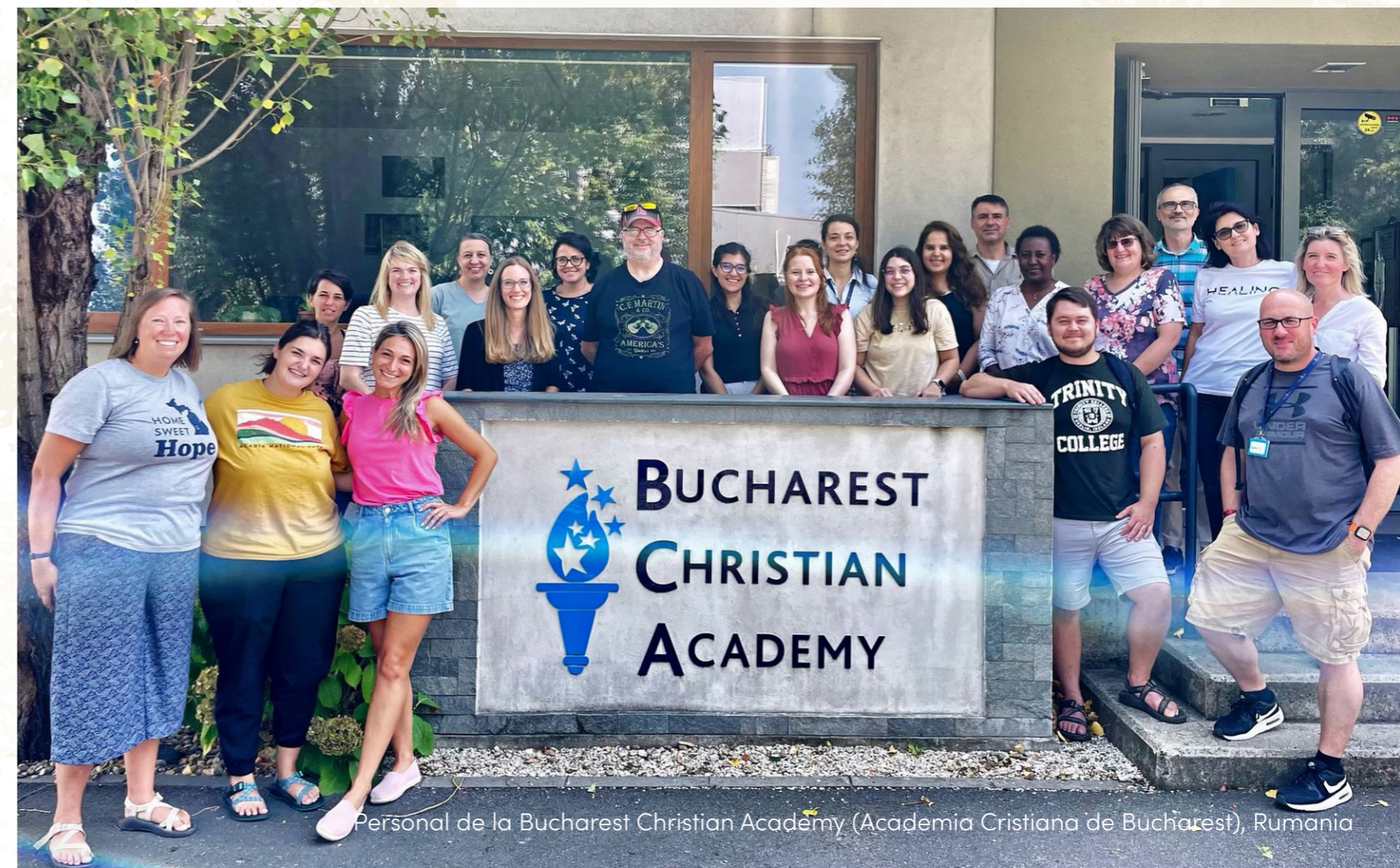
Personal de la Bucharest Christian Academy (Academia Cristiana de Bucharest), Rumania