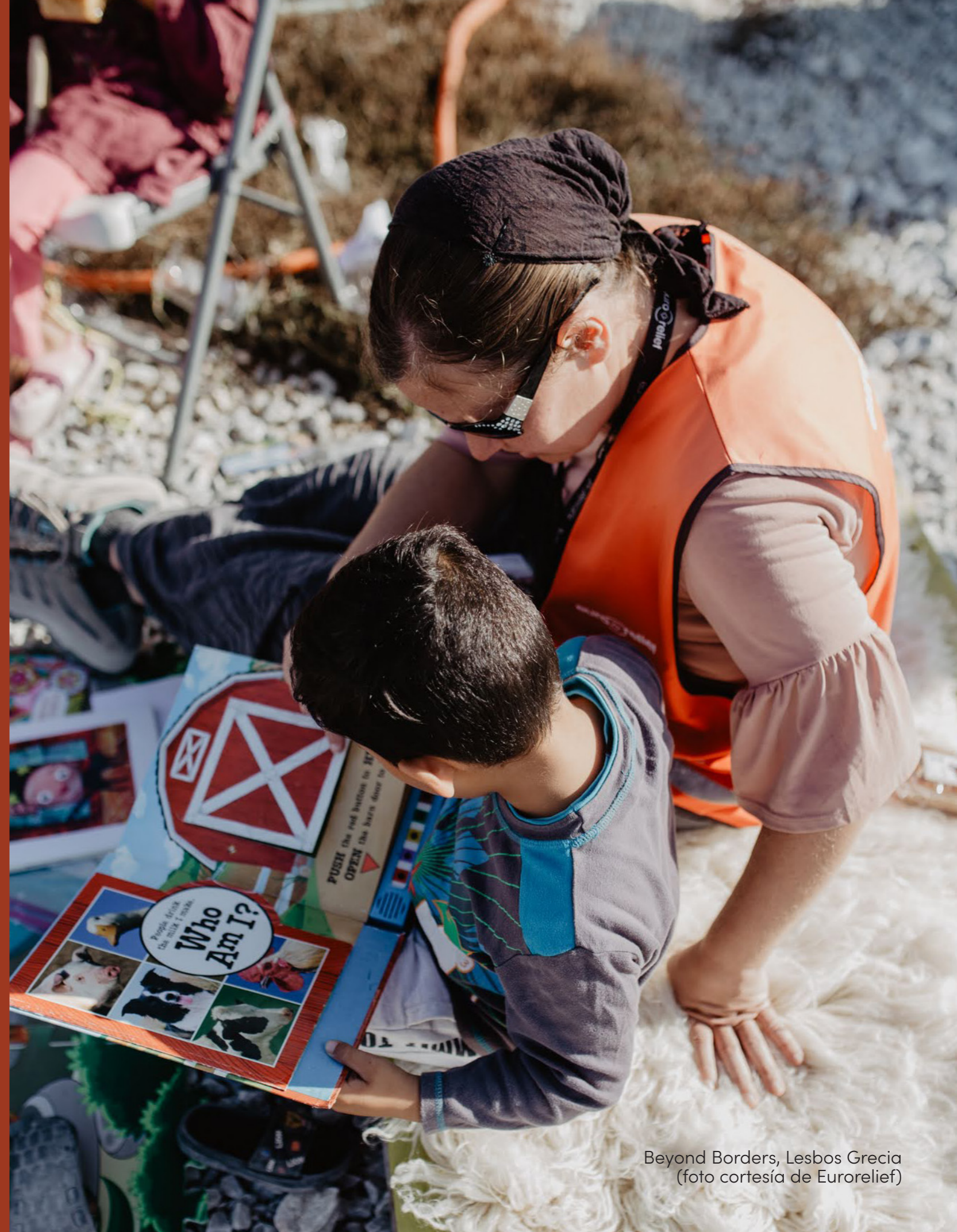
Beyond Borders, Lesbos Grecia