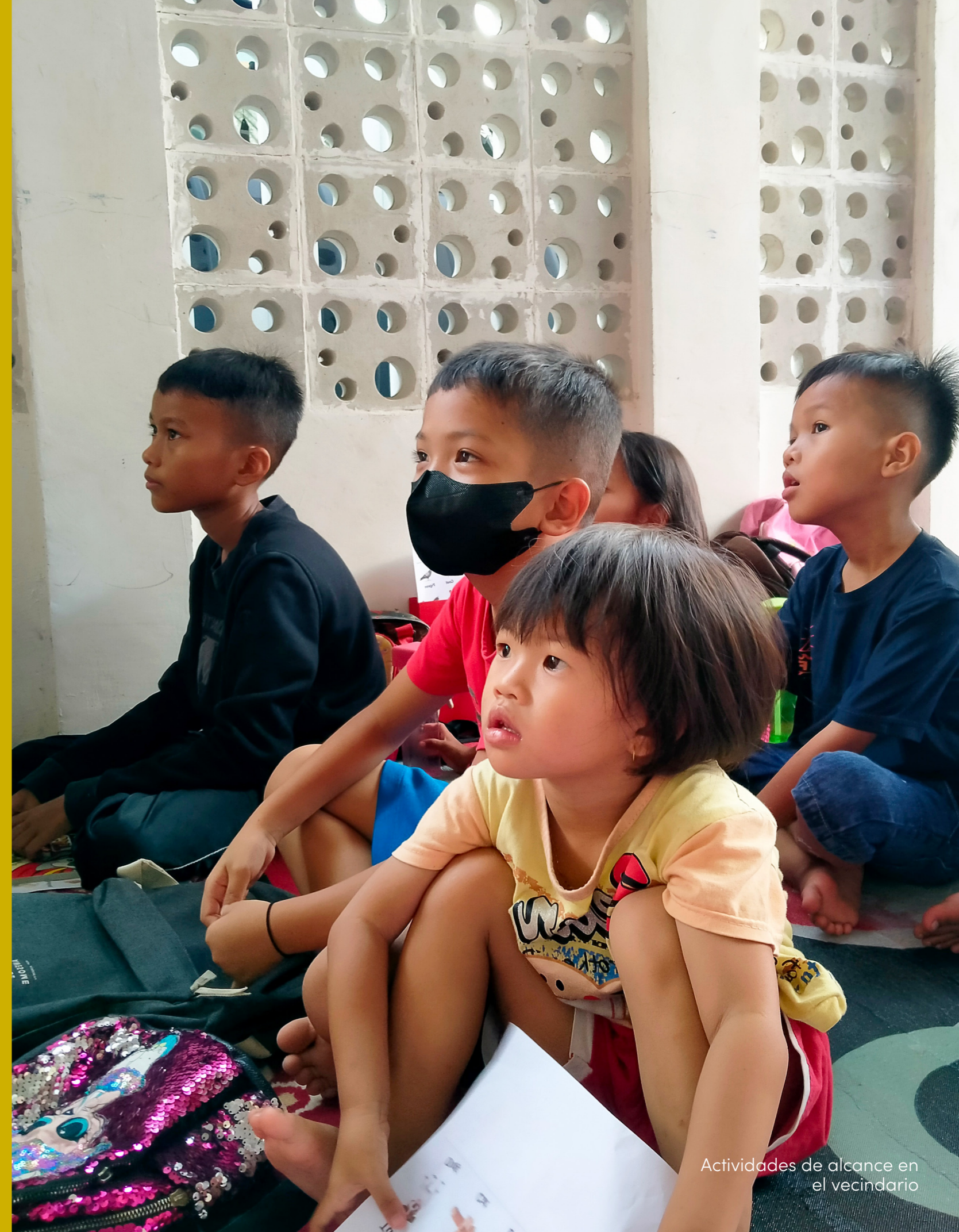
Actividades de alcance en el vecindario