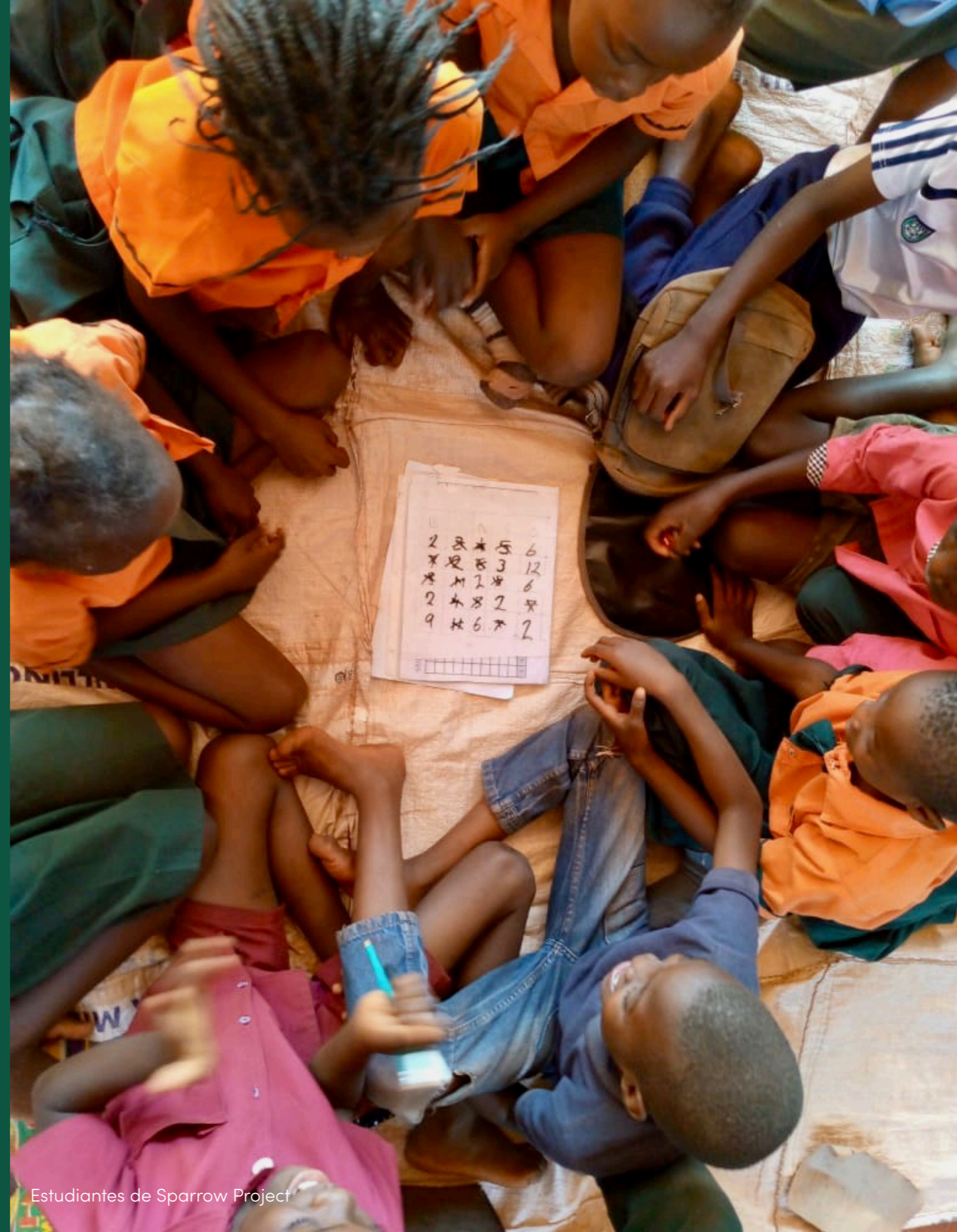
Estudiantes de Sparrow Project